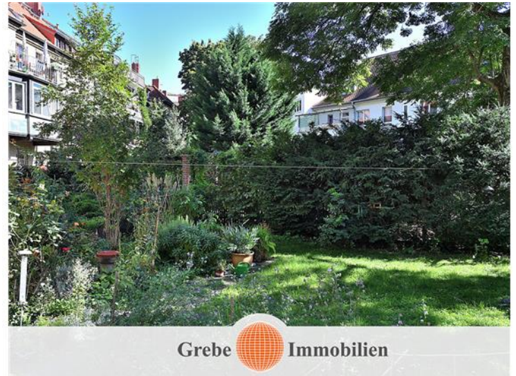
Einfriedung gesamtes Grundstück